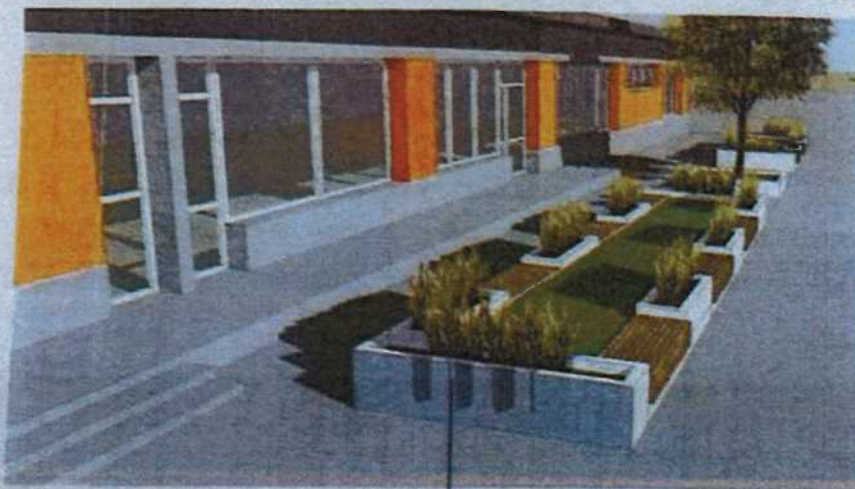
donice z betonu architektonicznego wymiary: wysokość - 55 cm szerokość - 50 cm długość - 180 cm długość donic narożnych - 230 cm