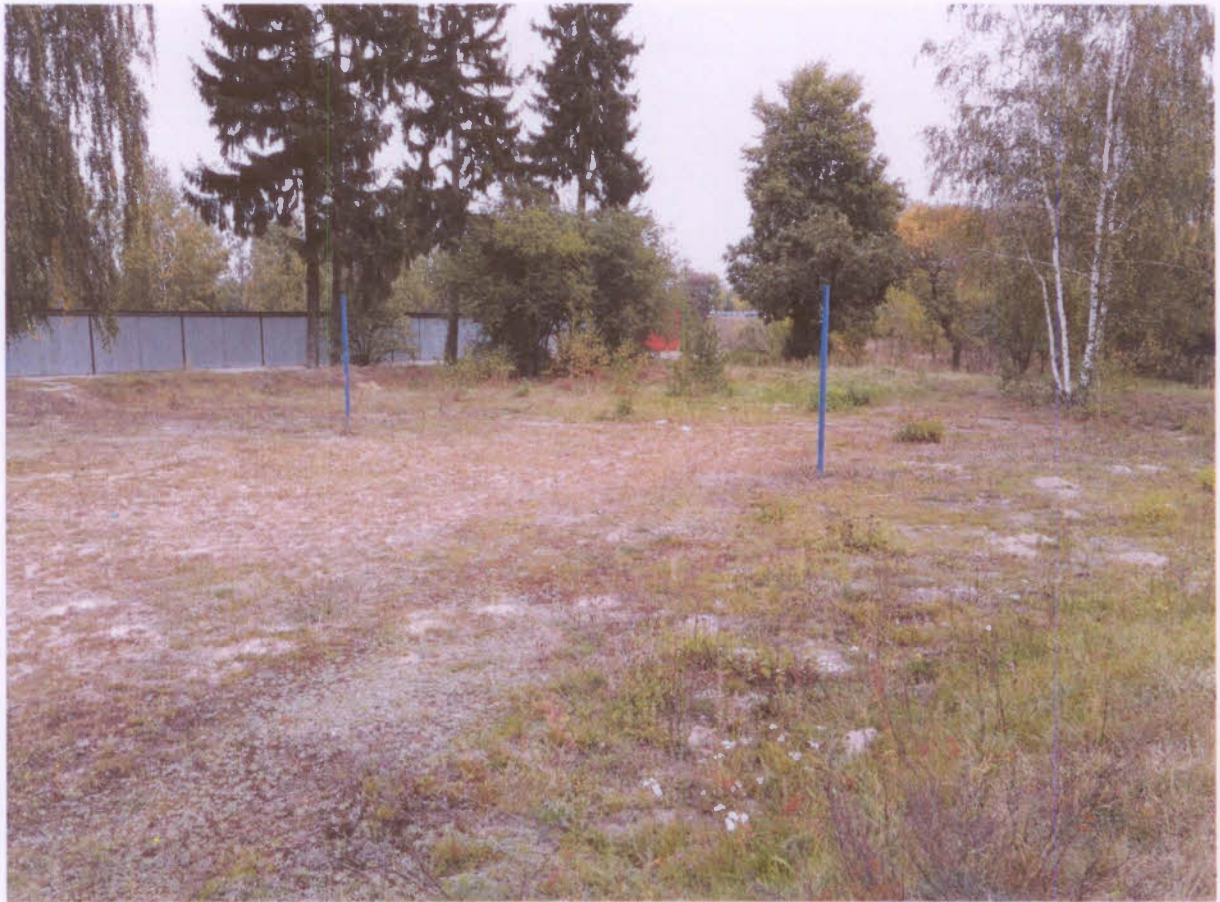
Miejsce planowanej inwestycji – wrzesień 2016.